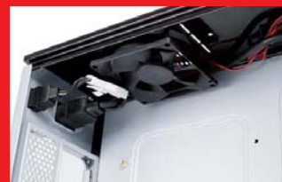
Cooler Fan 80 mm