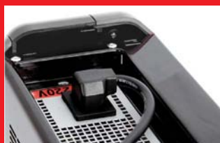
Conexión de alimentación