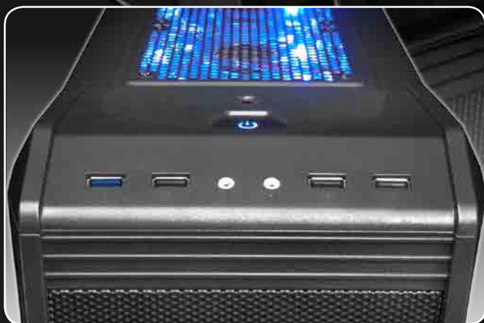
· Panel superior: 3 puertos USB 2.0 & 1 puerto USB 3.0 + Puertos de HD audio y Mic + Doble Controlador de Fan