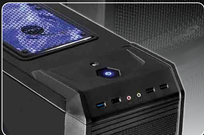
· Exclusivo Diseño de Topcover