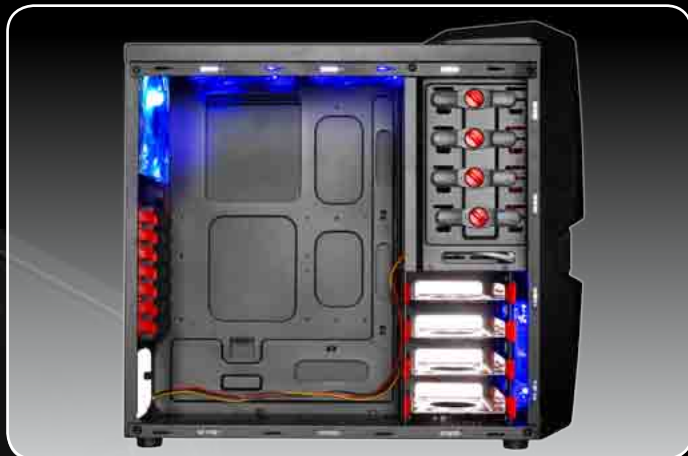
· Sistema de cables ocultos