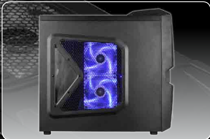
· Tapa lateral con dos cooler de 120mm con led azul