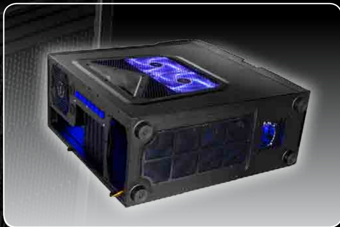
· Ventilación interior con filtro removible