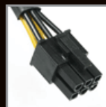
PCI-E Connector (6Pin)