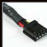
FDD Connector (4Pin)