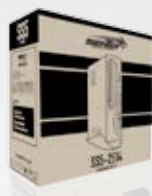
Design embalagem SS5-2514