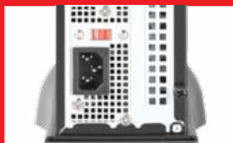
Conexão de energia