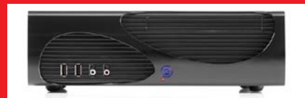
Posição horizontal inclui pés de borracha