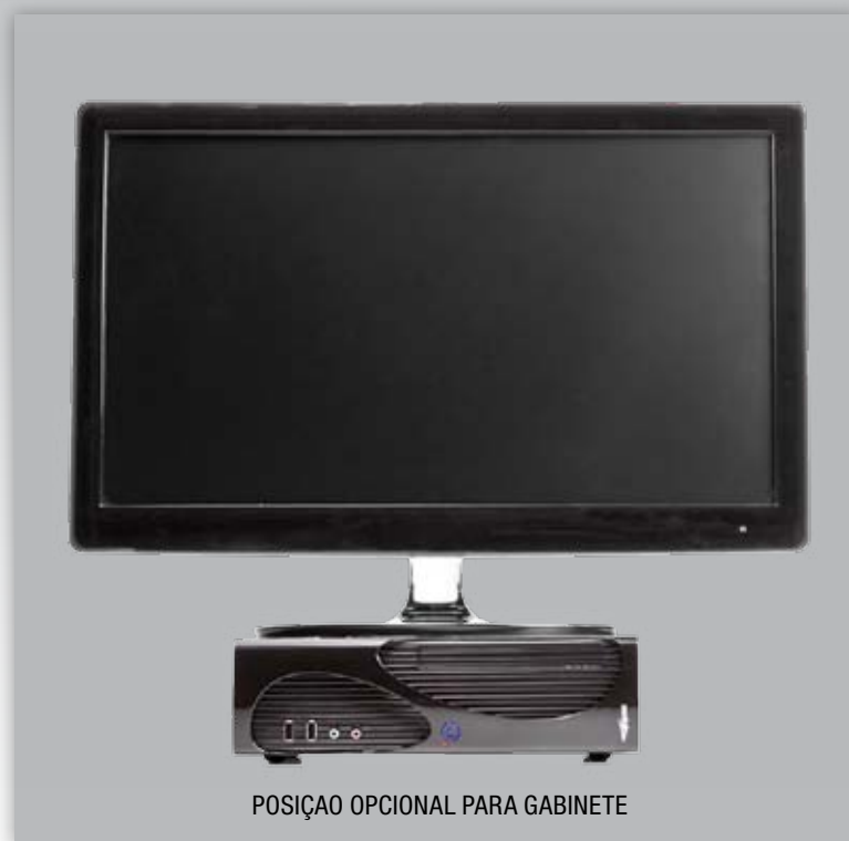
POSIÇÃO OPCIONAL PARA GABINETE